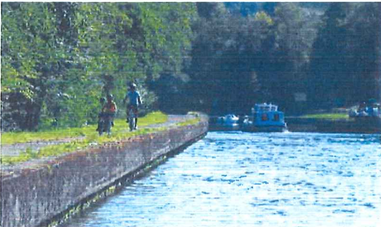
20 m